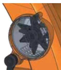
Chambre de broyage transparente à double paroi.