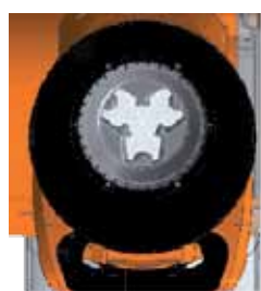
Ouverture de la trémie NEO.

RETROUVEZ LA BROCHURE COMPLÈTE ELIET SUR saelen.fr