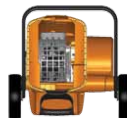
Tamis de calibrage.