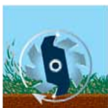
Après 90 heures

Différents types de lames pour différentes utilisations :