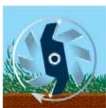
Après 30 heures...